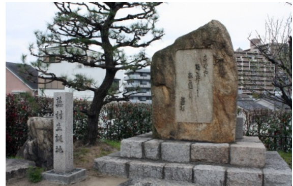
与謝蕪村生誕地石碑