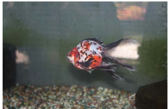
金魚資料館内金魚 I