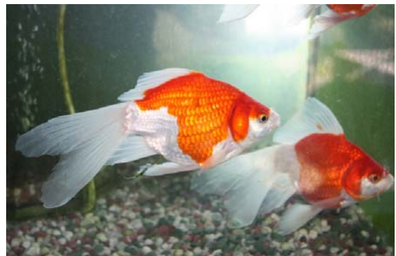
金魚資料館内金魚 III