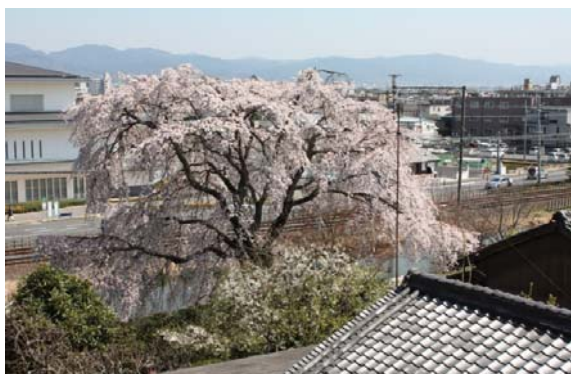
郡山城趾から見える枝垂れ桜