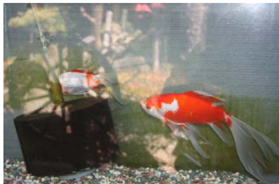
金魚資料館内金魚 II