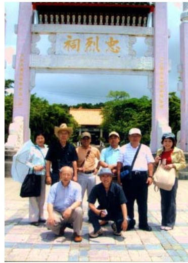
3日目 午後 高雄「忠烈祠」前