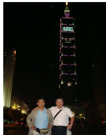
3日目 夜観光 台北 101タワーバック