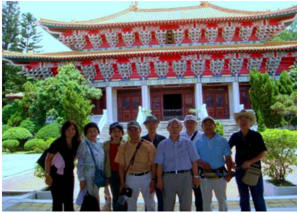
3日目 午後 高雄「忠烈祠」前