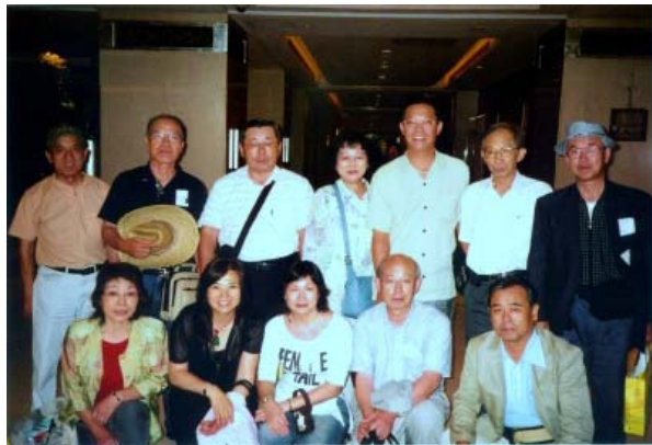
3日目 午後 夕食前 ガイドと一緒に