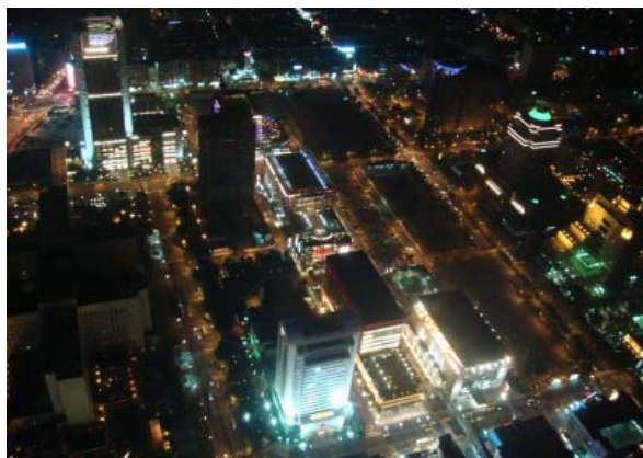
3日目 夜観光 台北 101タワー最上階景色