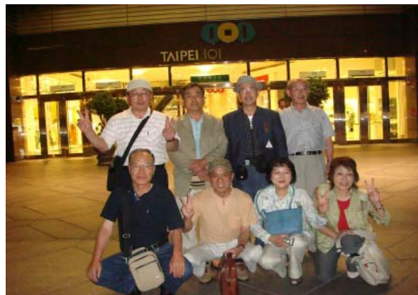
3日目 夜観光 台北 101タワー入口前